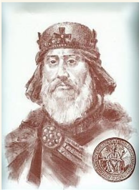
IV. Béla és pecsétje

„Elrendeltük, hogy a koronánk alá tartozó egész területen, arra alkalmas helyeken, erődítmények létesüljenek, várak épüljenek, ahol a nép meghúzhatja magát, ha veszedelem fenyeget. [...] Bárki magánszemély fekvésénél fogva erősségre alkalmas helyet birtokol, azt csere vagy egyéb jogcímen valamely embersokaságnak juttatandó erődítés céljából; ha pedig ilyen hely a királyi hatalom birtokában van, az hasonlóképpen magánszemélyek [...] használatába adassék, hogy ily módon [...] az erősségre alkalmas helyek mindig azoknak jussanak, akik gondoskodása révén az építmények sokaknak menedékül szolgálhatnak.”