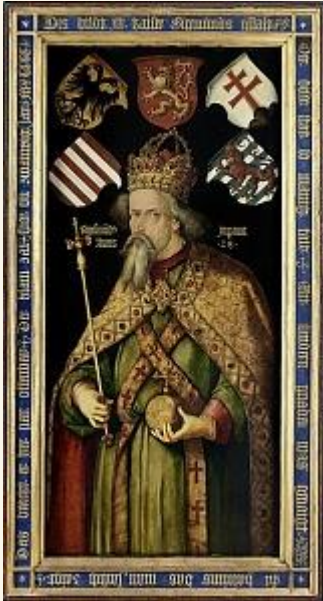
Luxemburgi Zsigmond Albrecht Dürer festményén

Luxemburgi Zsigmond magyar király a 24 szepességi városból a 13 legjelentősebbet és még további 3 várost a hozzájuk tartozó falvakkal együtt, régi jogaik megtartása mellett zálogba adta sógora, II. Ulászló lengyel király számára.