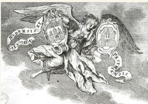
Buda és Pest címere - Mikoviny Sámuel rézmetszete a Notitiából

Buda és Pest egyesítésének szükségességét már évtizedekkel korábban sokan felvetették. A hazánkban sok mindenben élenjáró Széchenyi ebben is az elsők között volt. Széchenyi nem az ekkor is már dinamikusan fejlődő Pestet és nem is az ősi királyi székhelyet, Budát javasolta fővárosnak, hanem a kettőből létrejövő egységes Budapestet.