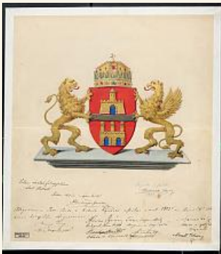
Budapest címere az egyesítésekor 1873-ban.

Magyarország fővárosaként Budapest 1873. november 17-én jött létre a Duna keleti partján fekvő Pest, valamint a nyugati partján elterülő Buda és Óbuda városának egyesítésével. 1950. január 1-jén a Budapest környezetében lévő települések hozzácsatolásával létrejött az ún. Nagy-Budapest, amelynek lakossága a 80-as években elérte a 2,1 millió főt.