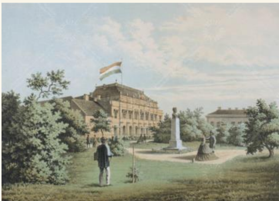
A Múzeumkert Bródy Sándor utcai oldala Slowikowski Ádám színes litográfiája

Az alapítónak az akcióval kettős célja volt, egyrészt megőrizni a magyar kultúra értékeit, másrészt műhelyt biztosítani a történelemi kutatások számára. "Felségfolyamodványt" nyújtott be a királyhoz, amelyben megfogalmazta indítékait. Mint írta, „több év során sok fáradsággal, gonddal és jelentős kiadásokba merülve szereztem meg, a drága hazának, amelynek ölében mind ezek összeszedésére alkalmat és módot találtam, és a közhaszonnak, amelyre mindig törekedtem és törekszem, szentelhessem". Így jött létre a róla elnevezett Széchényi Nemzeti Magyar Könyvtár, ami alapintézményévé vált az 1808-ban életre hívott Magyar Nemzeti Múzeumnak, melyet a nemzet rögtön magáénak érzett.