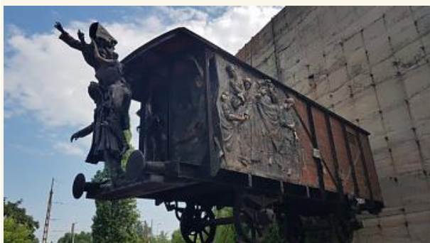
A Ferencvárosi pályaudvarnál felavatott Málénkij robot Emlékmű

A Szovjetuniónak óriási volt a munkaerő-szükséglete, hiszen egyrészt a harcok okozta károk felszámolása hatalmas mennyiségű munkaerőt igényelt. Másrészt a Szovjetuniónak a legújabb kutatások szerint a második világháború folyamán mintegy 27-30 millió fő volt az embervesztesége. Harmadrészt a világ legnagyobb létszámú hadseregét tartotta fenn, amely 1945 elején 7,1 millió, majd 1945 közepén már 11,3 millió fős volt. Tehát a szovjet birodalom rendkívül nagy munkaerő hiányban szenvedett. A foglyok pedig tömeges és ingyenes munkaerőt jelentettek. E munkaerő immár külföldről történő beszerzéséhez szolgált ideológiai alapul a kollektív bűnösség elve, amelyet ugyan a magyarokkal szemben a sztálini vezetés hivatalosan tagadott, de a gyakorlatban mindig is alkalmazott. De nem hagyhatjuk figyelmen kívül azt a tényt sem, hogy a háborúban kivérzett hazánknak mekkora veszteséget jelentett az évekig elhurcolt és a soha vissza nem tértek százezrei!