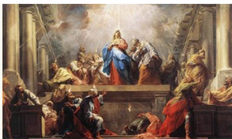
Jean II Restout: Pünkösd

„És adok néktek új szívet, és új lelket adok belétek, és elveszem a kőszívet testetekből, és adok néktek hússzívet. És az én lelkemet adom belétek, és azt cselekszem, hogy az én parancsolatimban járjatok és az én törvényeimet megőrizzétek és betöltsétek.”