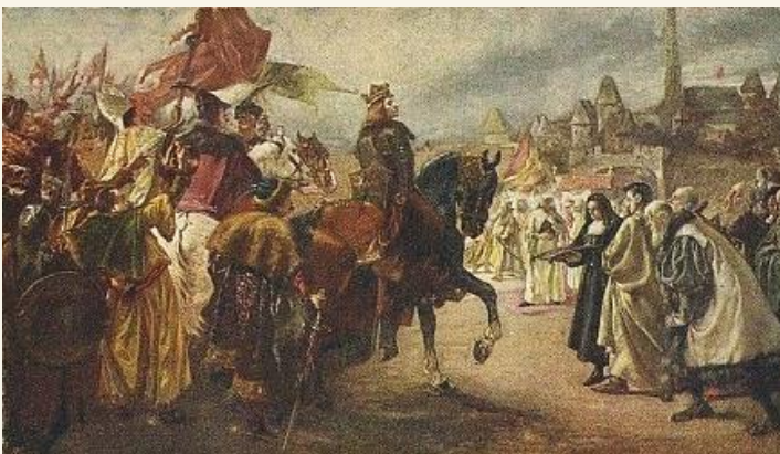
Koroknyai Ottó: Mátyás Bécs előtt

537 éve, Hunyadi Mátyás elfoglalja Bécsset