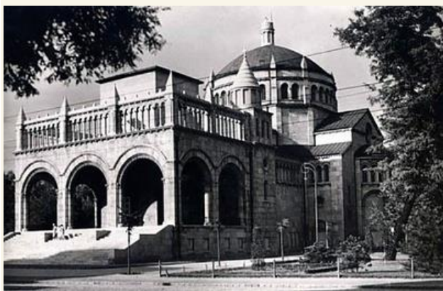
A Regnum Marianum a 30-as években

Felszentelésére 1931. június 14-én került sor Serédi Jusztinián hercegprímás közreműködésével.