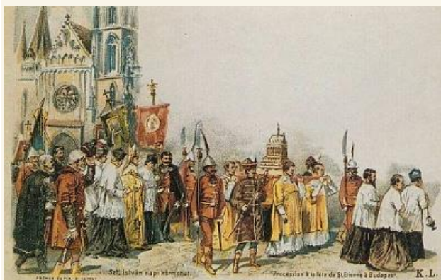
Szent István napi körmenet a Millennium évében

Az 1800-as évek elején II. József rendeletére a keresztesek férfirendje őrizte, majd a rend megszűnése után, 1865-től az esztergomi főegyházmegye feladata volt a Szent Jobb biztonságos őrzése. Az 1900-as évek elején a budavári palota Zsigmond-kápolnájába került, ahol 1944-ig volt látható. Szent István halálának kilencszázadik évfordulóján, 1938-ban a Szent Jobb az úgynevezett ' aranyvonaton ' országjárásra indult, s ez a körút jelentős mértékben hozzájárult Szent István király emlékezetének ébren tartásához.