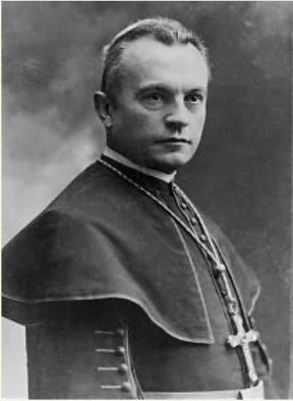
Prohászka Ottokár püspök, egyetemi tanár

Jelmondata: „ Dum spiro, spero. - Amíg élek, remélek. ”