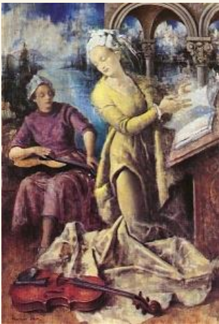
Kontuly Béla: A zene allegóriája.

„A zene a legnagyobb kerítő, a legveszedelmesebb csábító. Az értelem szűkölni kezd, mikor zenét hall. A zene értelemellenes. Nem megérteni akar, mint az értelem, hanem szétáradni, feldúlni, lefegyverezni, elcsábítani, megérinti bennünk a titkosat és fájdalmasat, feltárja azt, amit oly gondosan rejtettünk magunk elől, minden eszközzel fegyelmeztünk - olyan, mint a tavaszi vadvíz, feldúlja az értelem által aggályosan parcellázott, megművelt és megmunkált, szabályozott és fegyelmeztetett területeket. Ahová a zene kiárad, ott az értelem törvényei nem érvényesek többé. A gyönyörűségben, melyet a zene ad, a halál-vágy kéjes megsemmisülésének beteg érzései hullámoznak. A zene támadás.”