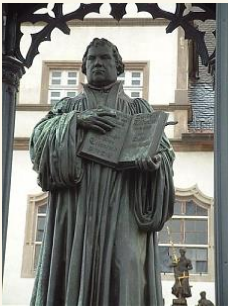
Luther wittenbergi szobra

Luther Márton (Martin Luther) a szász választófejedelemség bibliamagyarázó professzora, német Ágoston-rendi szerzetes 1517. október 31-én függesztette ki a wittenbergi vártemplom kapujára 95 pontba foglalt téziseit.