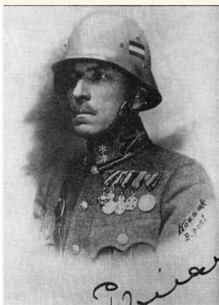
Prónay Pál, Lajtabánság bánja