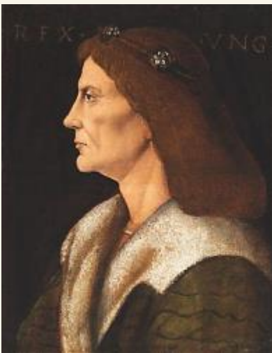
Andrea Mantegna Mátyás-portrójának másolata

Hunyadi Mátyás a kései középkor talán legjelentősebb magyar uralkodója. I. Mátyás, vagy gyakran Corvin Mátyás (Kolozsvár, 1443. február 23. - Bécs, 1490. április 6.) néven Magyarország királya 1458 és 1490 között. Az első olyan uralkodónk, aki leányágon sem állt rokonságban az Árpád-házzal. A magyar hagyomány az egyik legnagyobb királyként tartja számon, akinek emlékét sok népmese és monda őrzi. Népszerű ragadványneve az Igazságos.