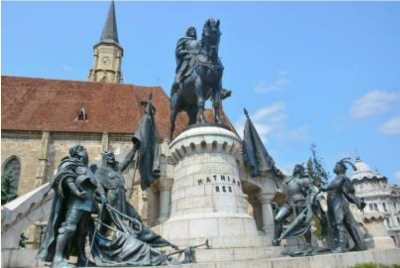
A kolozsvári Mátyás szobor

papírra festett, később lenvászonra húzott olajképet Lord Rothermere ajándékozta 1930-ban Horthy Miklósnak, és a budai királyi palotában állították ki. A 20. században Mátyásról alkotott képnek ez a fent bemutatott kép szolgált mintául.