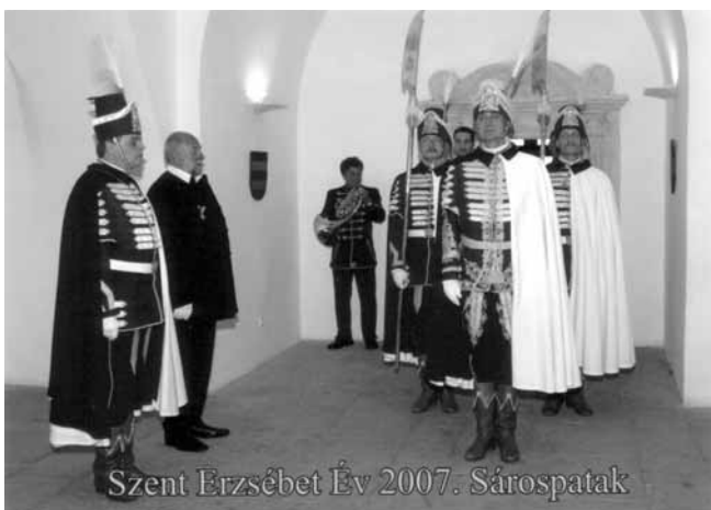
Szent Erzsébet Év 2007. Sárospatak