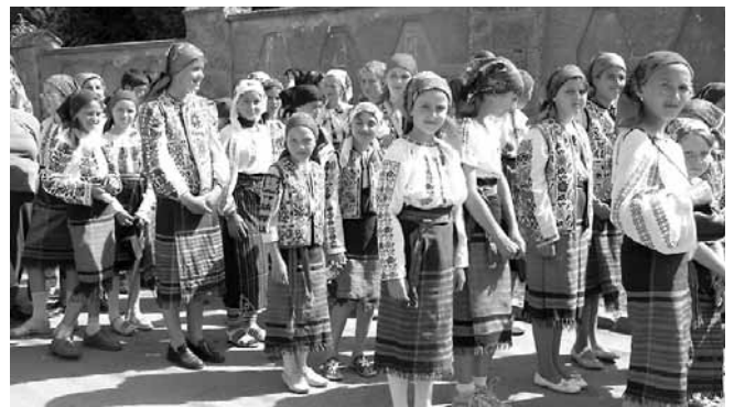
Csángó gyermekek szín pompás ünneplőben