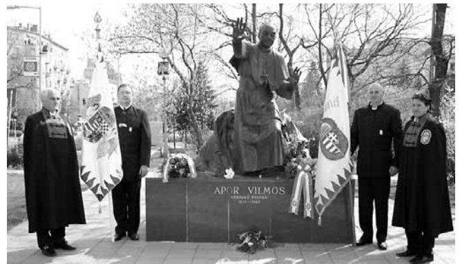
Boldog Apor Vilmos emlékműve, Budapest, III. ker. Díszörséget ad a Történelmi Vitézi Rend