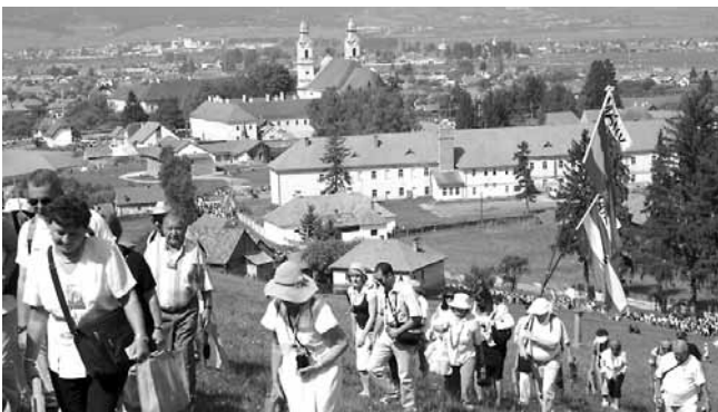
A Somlyóhegyről visszatekintve Csíksomlyóra: a Kegyetemplom

A somlyói búcsúra jöttünk, hogy találkozzunk égi édesanyánknál, akit Jézus adott nekünk, s akinek oltalmába Szent István helyezett. Hiszem, hogy Nagyasszonyunk szeretetlángjában újra egymásra fogunk találni, mint ezer évvel ezelőtt. Nem véletlen, hogy első írásos versemlékünk, az Ómagyar Mária-siralom (13. sz.), mint a címe is jelzi, Máriáról szól. Mindez azt bizonyítja, hogy népünk szívébe mélyen belegyökerezett a Mária-tisztelet. A vers maga egy monológ, amit a fájdalmas Anya mond, panaszol el, amikor Fiát szenved Jézussal, és szívesen halna meg helyette: „...Szemem könnytől árad,/ Én keblem bútól fárad,/ Te véred hullása/ Én keblem alélása./ Világ világa,/ Virágnak virága,/ Keservesen