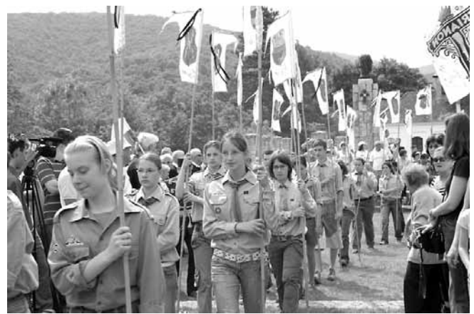
Váci cserkészek a 64 vármegye zászlóival