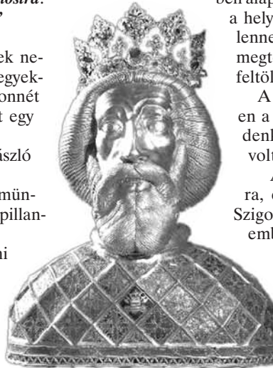
Szent László hermája (XV. sz.), Győri székesegyház, a Szent Korona és a Szent Jobb mellett hazánk harmadik kiemelt ereklyéje

A HŰSÉG. Nem olyan régen egy ünnepi beszédet mondtam és említést tettem a hűségről, az adott szó erejéről, arról, hogy ha valaki egyszer esküt tett, az védi és óvja a rábízottakat. Egyszer csak észrevettem, hogy többen megmosolyognak. Hát igen, de valóban ez lenne a világ rendje? Ő arra tanította alattvalóit, hogy nem érdekből, hanem önmagunk megbecsülése miatt kell kitananunk a haza, a szülőföld, a család szentsége mellett. László szívében, a mi magyar népünk lelké-