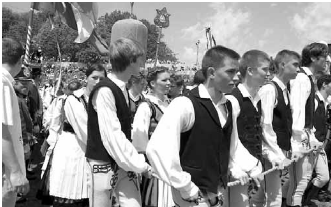
A kordon a labarummal. A legkiválóbb székely diákok kiváltsága: a Kegyetemplomból a Somlyó-heggyre felvinni az ősi szimbólumot