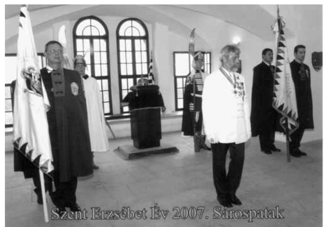
Szent Erzsébet Év 2007. Sárospatak