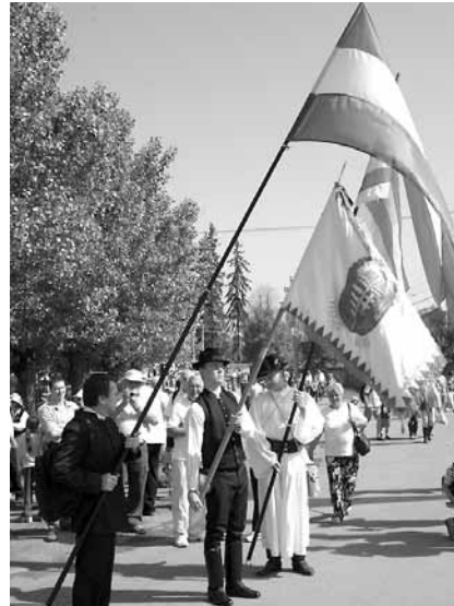
Felsorakoznak a Történelmi Vitézi Rend tagjai

egész szívvel szerették Krisztust és szolgálták embertársaikat. Szent Imrének, a tetterre kész ifjúnak hivatása az – írja Prohászka Ottokár – „hogya