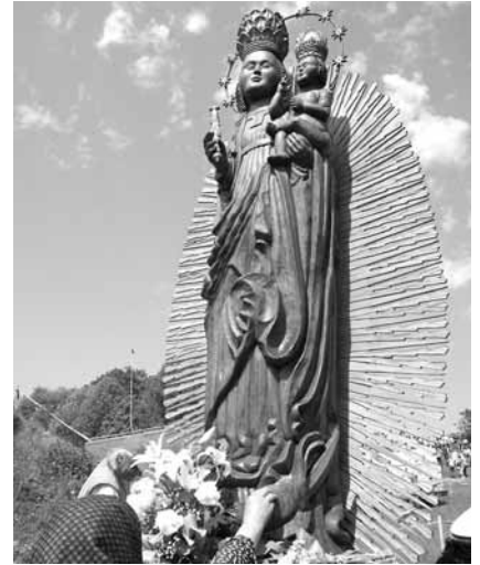
Napba öltözött Mária

A kemény tisztaságú Imre és a hős szeretetet sugárzó Erzsébet mellett, a magyarság jelen vezetői kevés kivétellel a történelem jellemtelen törpéi lettek. Ezért kell nekünk újra a magyarságnak az a krisztusi szeretettel ötvözött jellemvonása, amit nagy kultúrfilozófusunk Prohászka Lajos a