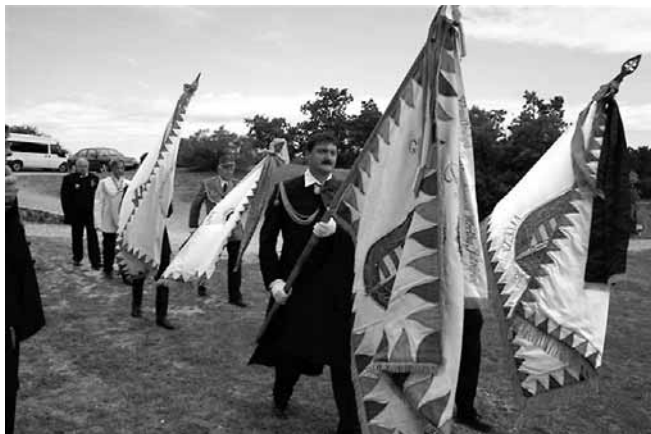
A T. V. R. zászlóinak bevonulása

2007. június 16-án, szombaton került sor a „Magyar Vitézek Emlékére” készített emlékmű felavatására a Pákozdi Mészeg-hegyi Katonai Emlékhelyen.