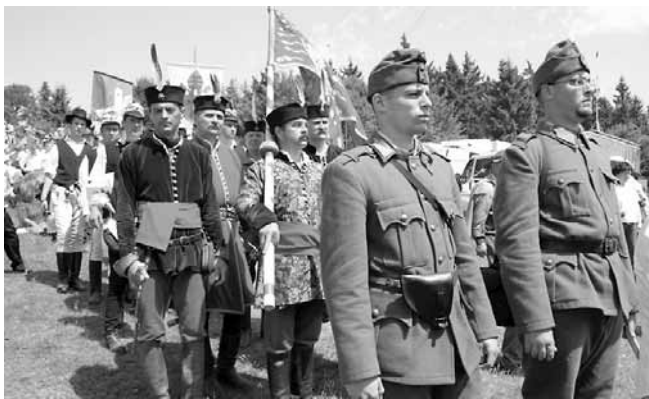
Hagyományörzők korbá egyenruhákban

közös múltat megismernék azok kései utódai is, akik „a kezdeti szeretettől” Buda elfoglalása után eltértek (vö. Jel 2,4). Az első félvezredben megélt Krisztusi egysé-günket kellene minden jó-akarátú embernek megélnie. Akkor a szétdarabolt nem-zettest tagjai elfogadják egy-mást és egyéforrnak. Szent István alapította Erdélyi püspökség ezer éve vissza-nemtéror alkalom arra, hogy atyáink hűségével szolgáljuk