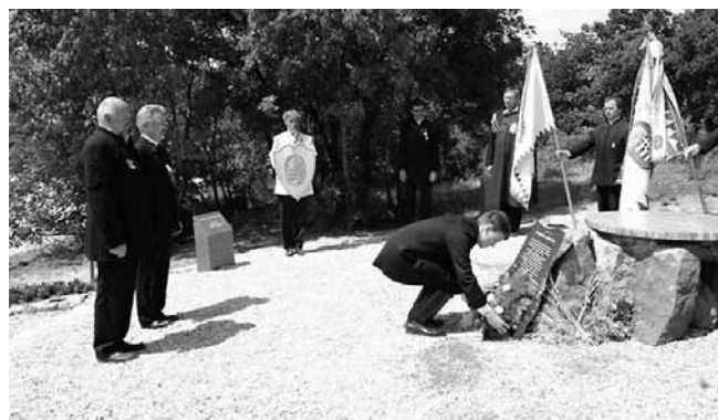
A magyar békefenntartók emlékművénel

Szóba került, hogy egy, az 1956-os forradalom és szabadságharc hőseihez is méltó emlékmű állítása is lehetséges e nemzeti emlékhely-sorban.