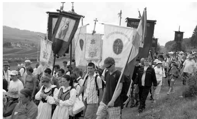
Keresztalják hazafelé indulnak

Máriához jövünk megkö-szönni a Szent István alapí-totta (1009) Erdélyi Püspök-ség 1000 esztendejét. Az el-telt 1000 évből 550 közös volt a reformátusok, az evangéli-kusok, és az unitáriusok ősei-vel. Gazdagító lenne, ha azt a