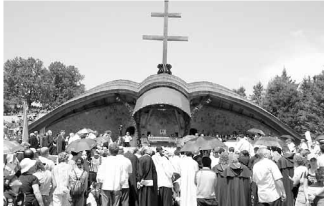
A Hármashalom oltár

kínzatol,/ Vas szegekkel veretel. (...) Kegyelmezzetek fi-amnak,/ Ne legyen kegyelem magamnak,/ Avagy halál kín-jaival,/ Anyát édes fiával/ Egy-temben öljétek!” Szívet-lelket átmelegítő, nagyszerű érzés végigolvasni Mária-költésze-tünket és eldúdolni énekeinket. Mindeniken átsüt valami bájos kedvesség és gyermeki ragaszkodás a Szűzanyához. Nagyszerű Mária-kép bomlik ki a pünkösdi zarándokok énekéből és imájából, amelyet