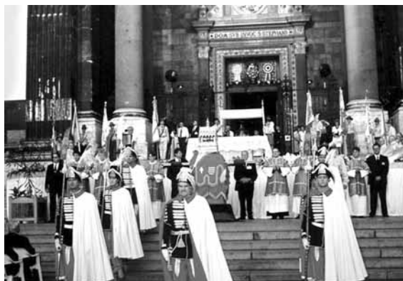
Szent Jobb körmenet (fotó: 1998)

Árpádházi Szentek, szent Magyar Királyok, Áldva, kegyelettel gondolunk ma rátok, Virrasztó szemekkel könyörgünk hozzátok, Szent csodáitokkal mentsétek hazánkot, Szétszéledt népünköt, szép Magyarországot. Isten-verte rosszak Mennyt tagadó bűne! Mivé lett „Király Úr” ezeréves műve? Hol Imre erénye? László bátorsága? Erzsébet jósága – Margit mártírsága, Piroska példája? – Árpád drága vére. Áldva néz fel Rátok fel a magas Égbe Mai Magyaroknak szétszórt árva népe.