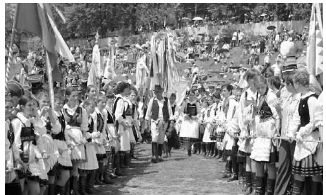
Székely fiatalok sorfala között érkeznek a zarándokok a mogyoródi fa-ragott kereszttel, melyen minden szalag egy-egy települést jelent