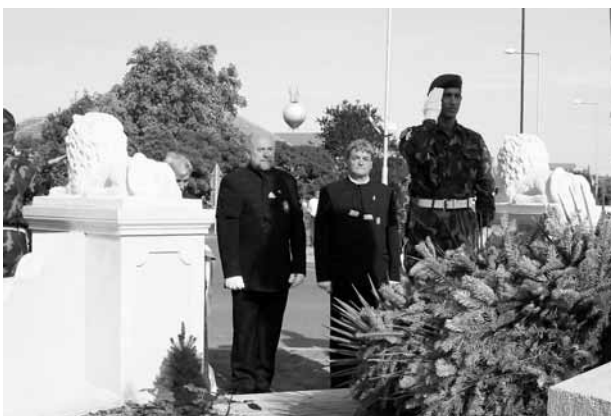
A főkapitány leteszi a Vitézi Rend koszorúját