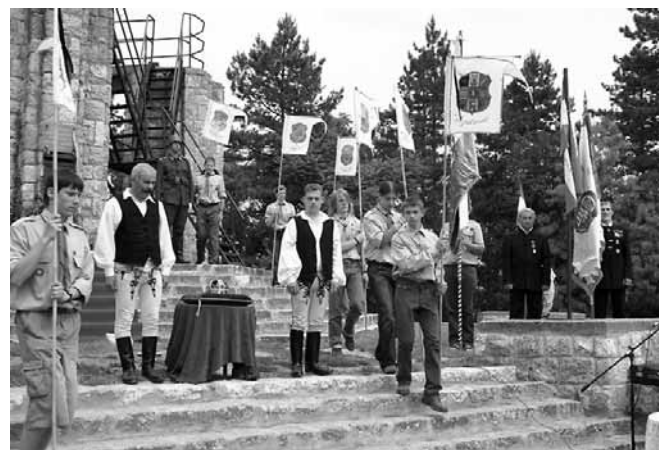
Díszőrség a Szent Korona másolatának